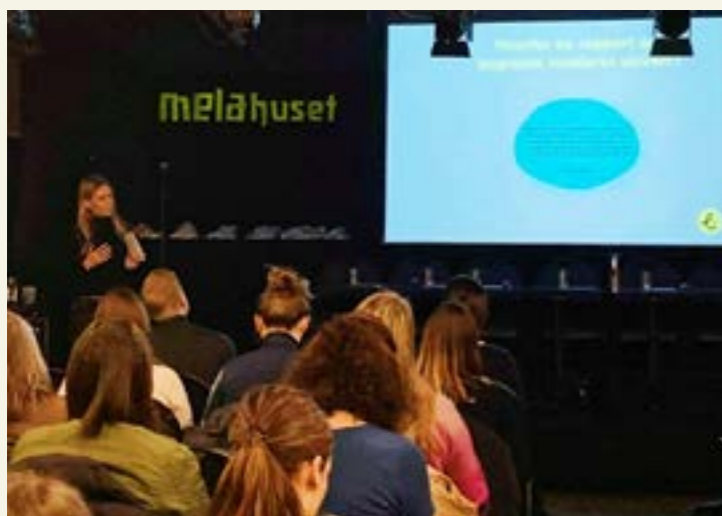
Rapportlansering om moderne slaveri.