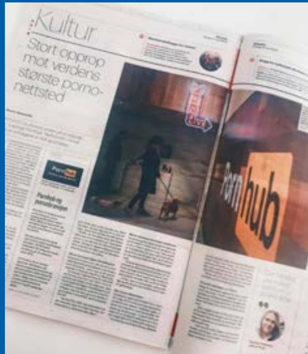
Avisoppslag "Stort opprop mot verdens største pornonettsted" 21.april 2020

norske selskapene til etterfølgelse, da de i 2019 vedtok at selskaper som får mer enn 5% av sine inntekter fra produksjon av pornografi skal utelukkes fra investeringene. Under rapportlanseringen understreket barne- og familieminister Kjell Ingolf Ropstad og statssekretær Aksel Jacobsen (UD) viktigheten av tematikken i sine videohilsener.