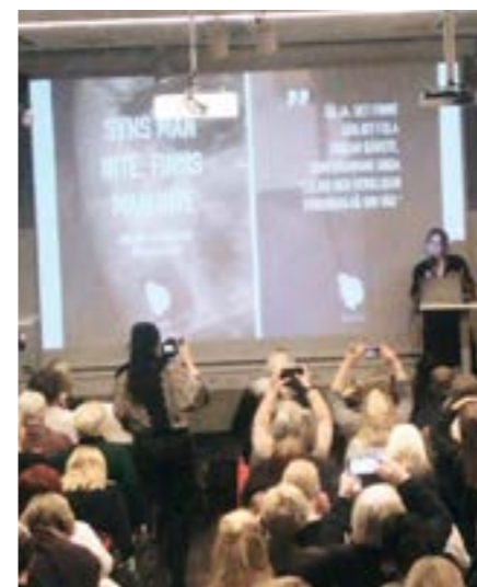
Seminar om porno og sexhandel i Stockholm, februar 2022.