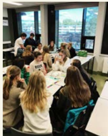
Skolebesøk hvor elevene får prøve «Traffickalt Grunnkurs»

Også gjennom 2020 har vi gjennomført surveys i etterkant av våre undervisninger, i sammenhenger der dette lot seg gjøre. Vi mottok 56 svar på spørreundersøkelsen for det året, og resultatene bekrefter igjen at 91,1% av respondentene oppgir at de lærte noe nytt om menneskehandel, og 57,1% at de har lært noe nytt om menneskehandel knyttet opp mot FNs