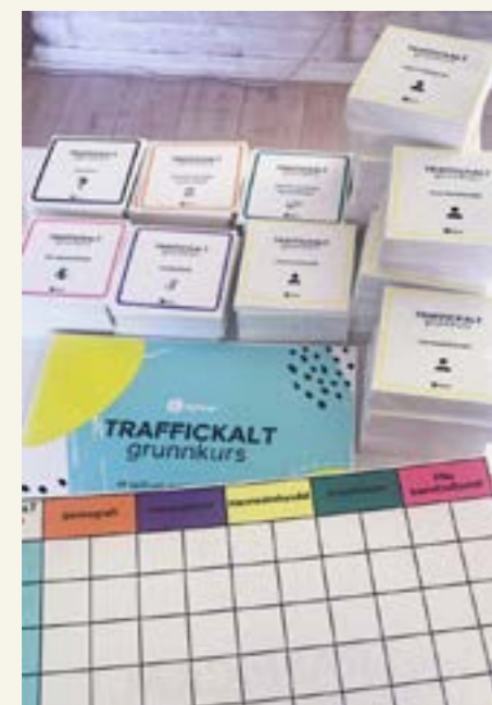
Vårt selvlagde spørrespill kalt «Traffickalt Grunnkurs»

bærekraftsmål. Det synliggjøres at få har hatt omfattende kunnskap om tematikken fra før. I spørreundersøkelsen oppga 69,6% at de vil la være å kjøpe varer og tjenester svart, 39,3% vil i større grad enn før etterspørre etiske varer og tjenester, og 50% oppga at de vil la være å kjøpe sex basert på undervisningen. Disse stikkprøvene viser at arbeidet vårt bidrar til holdningsendring.