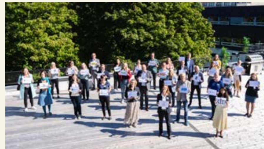
Lansering av Koalisjonen KAN.