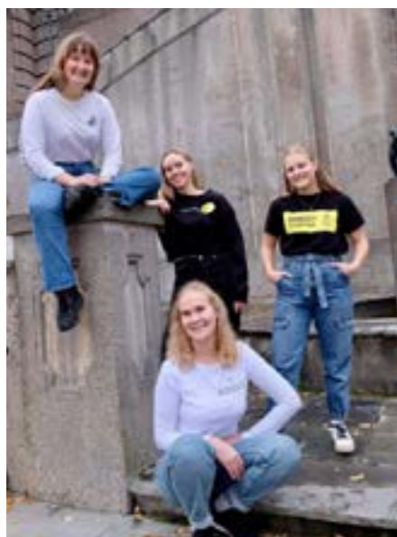
Samarbeid om podcastepisode MR-lov for næringslivet.

lightup har en Kunnskapsbank som benyttes jevnlig av frivillige og lokallagsmedlemmer i organisasjonen, og vi har ved gjentatte anledninger formidlet materialet til skoleelever og studenter vi har vært i kontakt med gjennom vår undervisningsvirksomhet. Flere unge har ønsket å få hjelp til å finne informasjon om menneskehandel, tvangsarbeid, prostitusjon, og annen seksuell utnyttelse fordi de har hatt en skoleoppgave. Vi har dermed bistått disse med tips om oppdatert forskning og rapporter. På denne måten kan vi påpeke at kunnskapsbanken var en verdifull ressursbank for en rekke unge i vårt nettverk gjennom 2020. Gjennom 2020 har Kunnskapsbanken kun vært tilgjengelig som en intern ressursportal. I årene fremover ønsker lightup å jobbe med å katalogisere materialet og gjøre kunnskapsbanken tilgjengelig på nett.