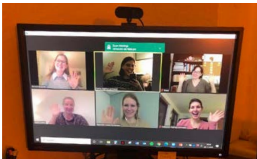
Zoom-møte med lightup International.

I løpet 2020 har vi samarbeidet med en rekke organisasjoner og aktører. Vi har fortsatt å ekspandere vårt samarbeidsnettverk. I tillegg til et kontinuerlig samarbeid med søsterorganisasjonene i Tyskland og Østerrike der vi utveksler samfunnsaktuelle oppdateringer på menneskehandelsfeltet, forskningsrapporter m.m, samarbeider vi med en rekke organisasjoner og aktører.