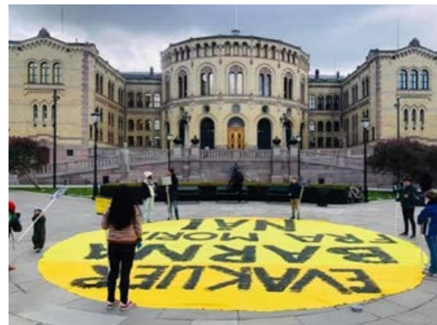
Fra solidaritetsmarkeringen utenfor Stortinget i Oslo, 20.september

«50 er for lite». Solidaritetsmarkering foran Stortinget med samtlige ungdomspartier og en rekke ungdomsorganisasjoner for evakuering av barn og familier på flukt fra Moria.